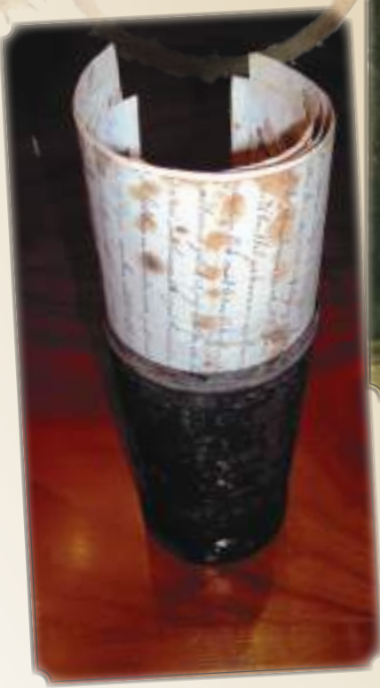
Foto van het doosje waar de correspondentie in stak.