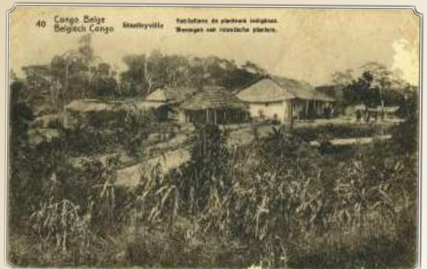
Een opmerkelijke postkaart uit Congo, die het niet bezette Poperinge bereikte.