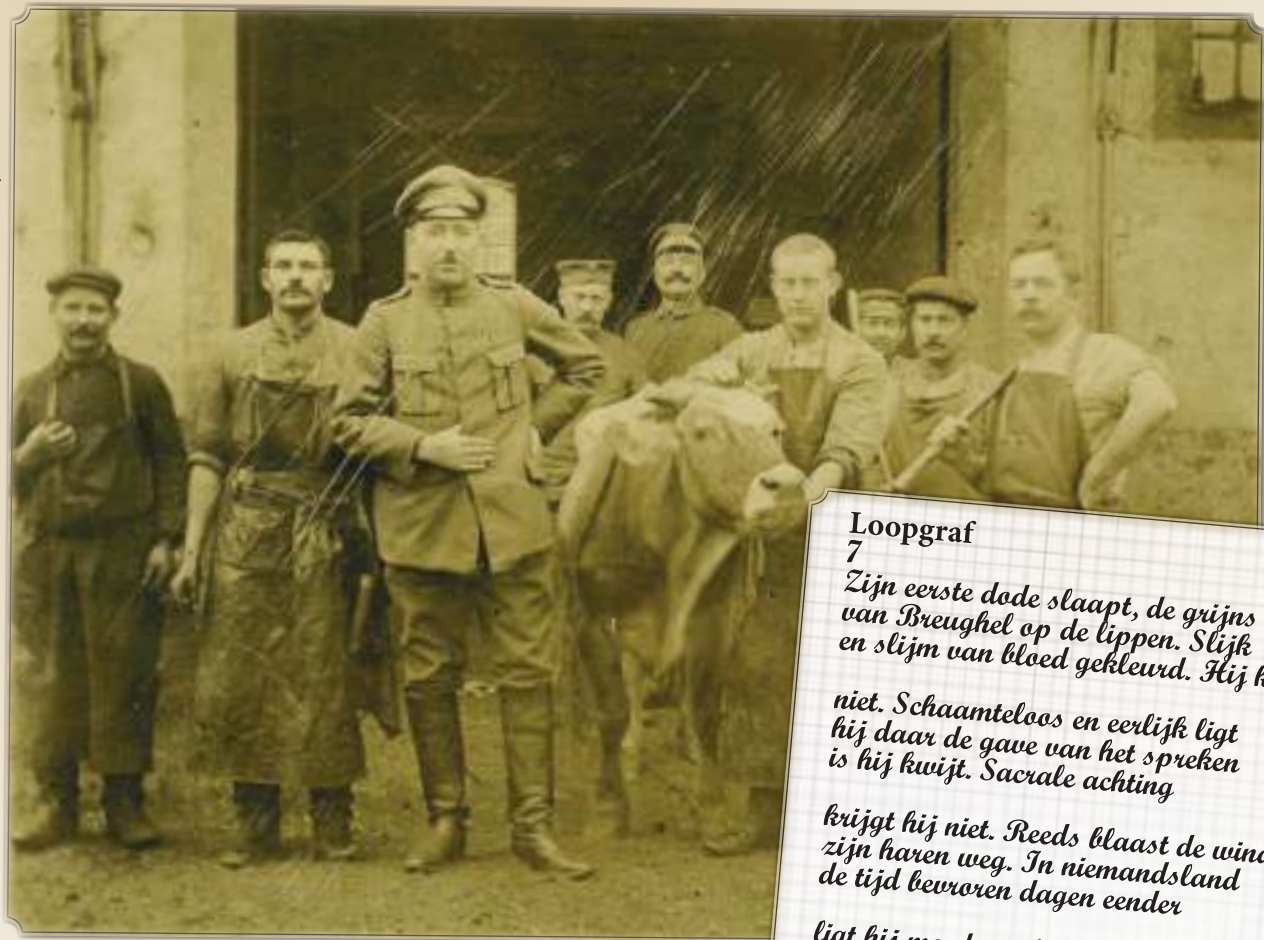
Opesing koe door bezetter in Wetteren.

Ook het verzamelen van materiaal gaat door: beelden en documenten rond de Eerste Wereldoorlog zijn dus nog steeds welkom!