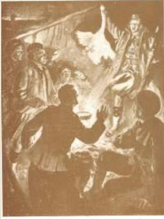
Engelische soldaten... Kerstmis... de laatste twee zelden...