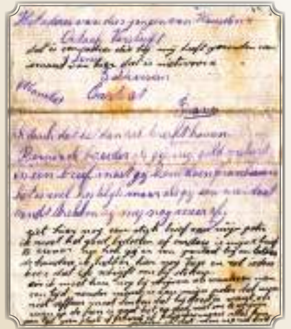
Een voorbeeld van hoe de brieven door de twee broers werden gebruikt om naar huis te schrijven.