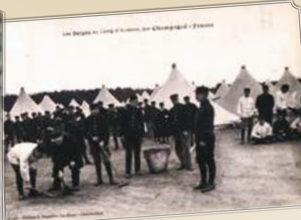
Belgische soldaten in het tentenkamp van Auvours.