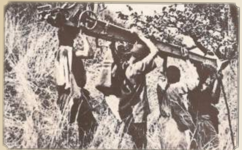
Sjouwen met wapens door het oerwoud.