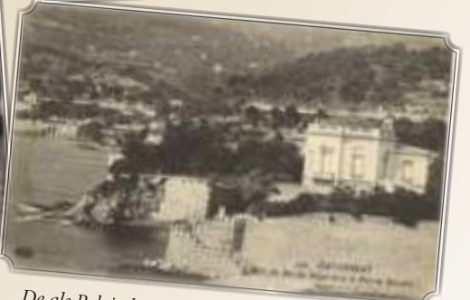
De als Belgisch Militair Hospitaal ingerichte Villa Les Cèdres in Saint-Jean-Cap-Ferrat te Frankrijk.