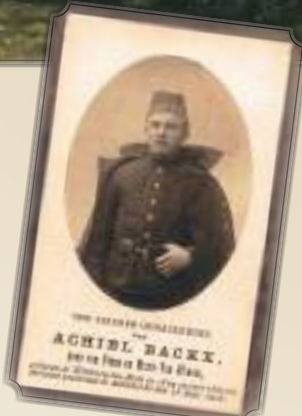
Voorzijde bidprentje met afbeelding.