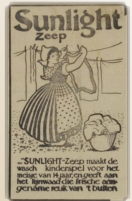
Affiche Sunlight zeep, Gazet van Schellebelle

Affiche Sunlight zeep, Gazet van Schellebelle, 22 maart 1914