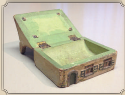
Geschonken door de Union patriotique des femmes belges in 1915 aan de Dendermondse oorlogswezen.