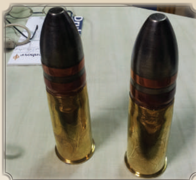
Foto's van een obus, scansessie Buggenhout 26 maart 2013