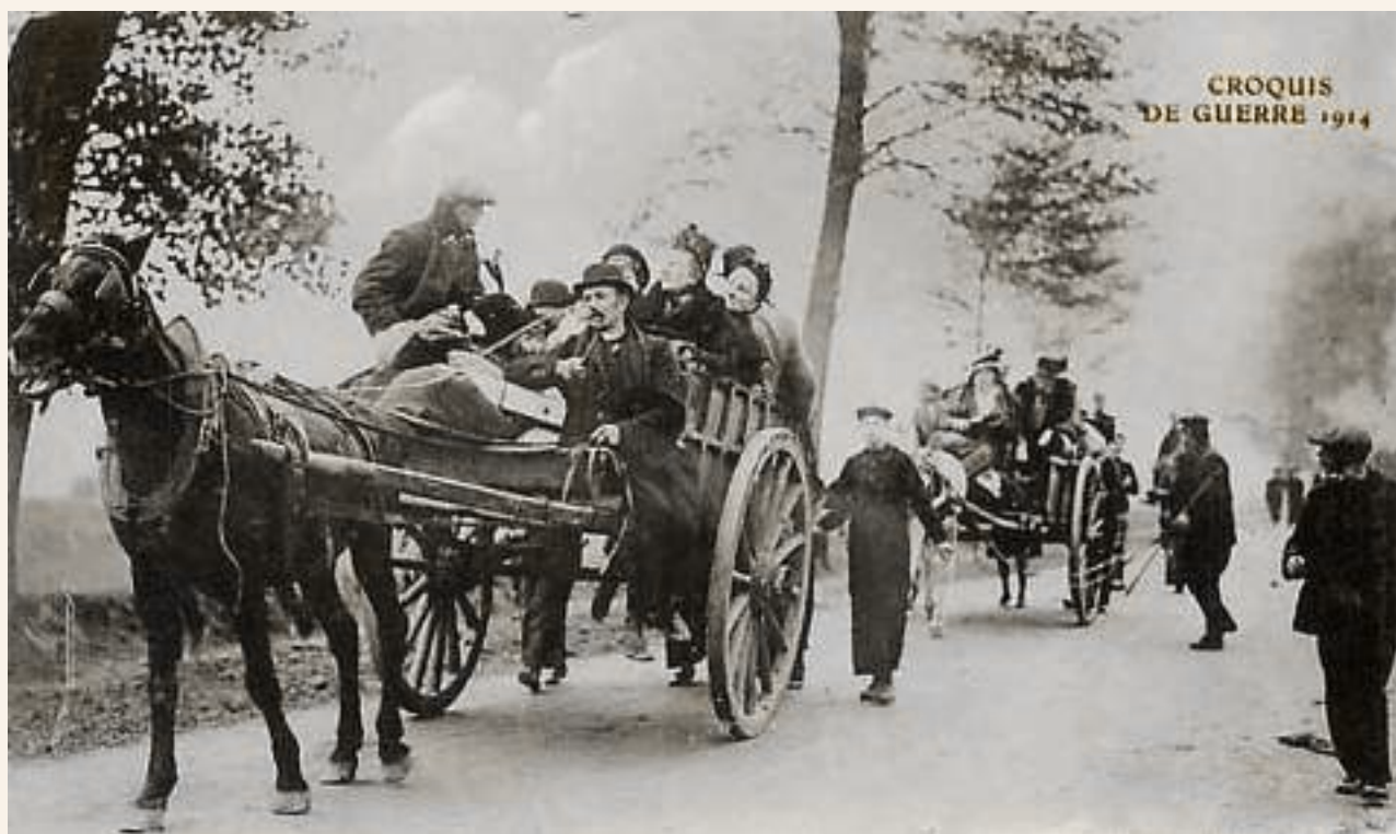
Mensen op de vlucht.