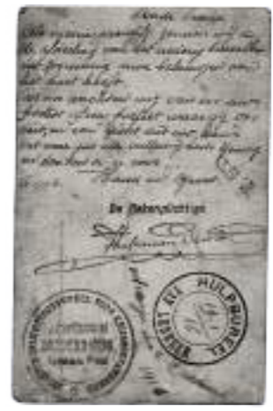
Postkaart verstuurd via het Inlichtingsbureau voor Krijsgévangenen met de vraag om informatie (verstuurd 16 januari 1916).

Voorgedrukte krijsgévangenenkaart, te verzenden als veldpostkaart. Gedateerd 27 april 1915. Afgestempeld te Soltau op 20 mei 1915.