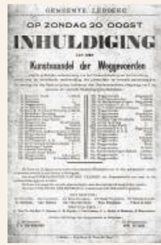
Aankondiging van de inhuldiging van het vaandel der weggevoerden uit Lebbeke.

Na de oorlog werden de tewerkgestelden en geïnterneerden vergoed. Een speciaal opgerichte Rechterbank voor Oorlogsschade oordeelde over het recht op een vergoeding. De opgeëisten hadden in de eerste jaren na de oorlog ook nog recht op verschillende vormen van materiële hulp, zoals kledij en schoenen.