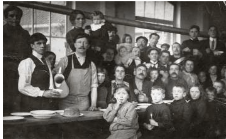
Foto van een groep vluchtelingen in Nederland.

De opvang van de vluchtelingen kostte de gastlanden handenvol geld. De inspanning was reëel en niets kan deze ongelofelijke solidariteit in vraag stellen. Toch valt het niet te ontkennen dat de solidariteit langzaam verwaterde. Die terugval ging gepaard met de langzame afbrokkeling van de vluchtelingenstatus. Naarmate de oorlog ook de levensstandaard in de gast-