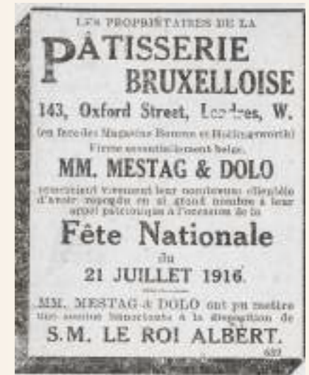
Krantenartikel in l'Indépendance Belge (19/7/1916).

Het is hartverwarmend dat de Dendermondenaars elkaar in deze penibele tijden niet vergaten.