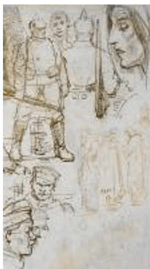
Fragment van een tekening van de hand van De Beule (datum en plaats onzeker).

Het oeuvre van De Beule is zo omvangrijk dat tot op heden niet al zijn werken gelokaliseerd en geïnventariseerd zijn. En er is één grote blinde vlek in zijn loopbaan: de oorlogsperiode. Hij vluchtte bij het uitbreken van de Eerste Wereldoorlog met zijn zwangere vrouw naar Engeland. Hun zoon Marc werd er op 13 september 1914 geboren. De enige sporen van hun verblijf in Engeland gedurende de hele oorlog zijn tekeningen die De Beule er heeft gemaakt.