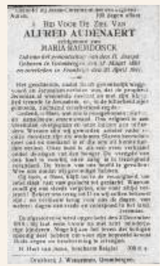
Doodsprentjes van opgeëiste Grembergenaren.