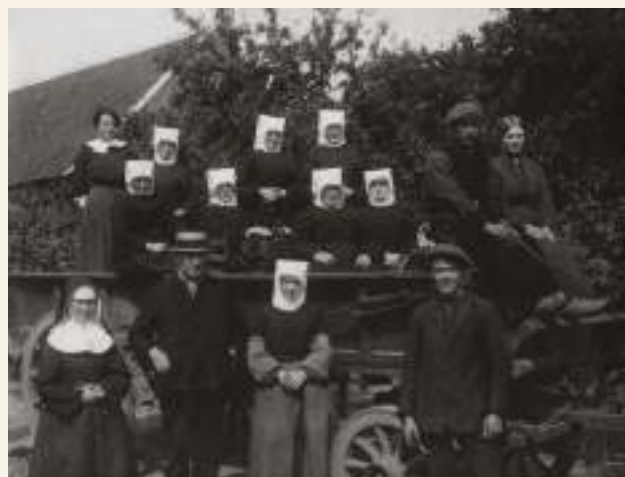
Nonnen uit Dendermonde op de vlucht naar Wichelen.

~~~~~ Bronnen: - DE SCHAEFDRIJVER S., De Grote Oorlog, 104. ~~~~~