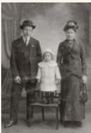
De familie Verheyden-De Petter vluchtte vanuit Dendermonde naar Alexandria, Schotland.

In de eerste oorlogsdagen werden Dendermonde en de omliggende gemeenten overspoeld door vluchtelingen. Een paniekgolf van bange mannen, vrouwen en kinderen die hun hele hebben en houden op karren en koetsen hadden gestapeld, ging het oprukkende Duitse leger vooraf. Ze brachten verhalen mee van brandende dorpen, plunderingen en Duitse gruweldaden. Een groot deel van de inwoners bleek niet immuun voor de horrorverhalen van de vluchtelingen en besloot zelf ook veiliger oorden op te zoeken. Heel wat mensen verlieten hun geboortedorp en gingen op weg, zonder te weten waar naartoe en zonder te weten wanneer en of ze nog zouden terugkeren. Ze namen mee wat ze konden dragen en volgden de vluchtelingenstromen naar het Land van Waas, Gent, Antwerpen, Oosten-